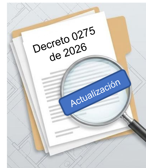
Imagen generada con IA de Google Gemini (2025).

Creación del Programa Nacional de Entrega Voluntaria de Armas por un plazo de 12 meses, prorrogable por igual término, contados a partir de la expedición de este decreto.