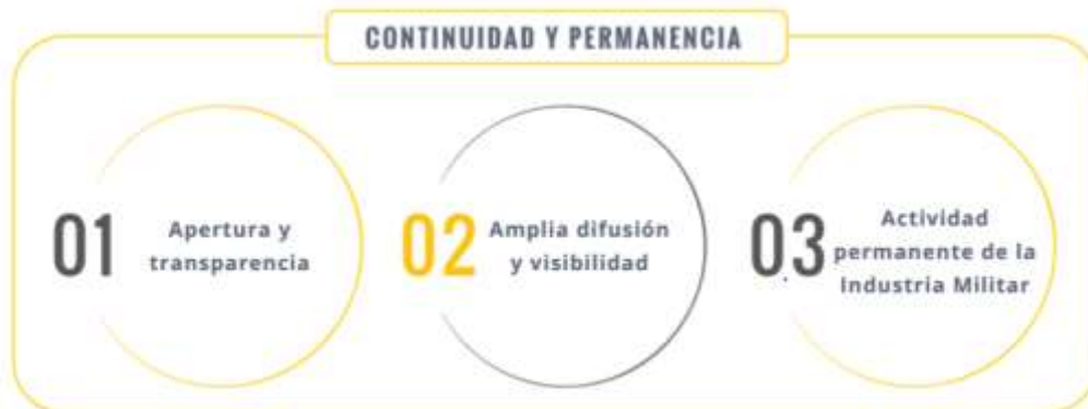
Mapa Gráfico 2: Art.49, Ley 1757 de 2015

La versión vigente y controlada de este documento, solo podrá ser consultada a través del Gestor Documental Indudaruma. La copia o impresión diferentes a la publicada, será considerada como documento no controlado y su uso indebido no es responsabilidad del Grupo Administrador de Documentos de la Industria Militar.