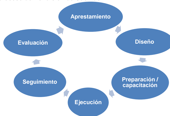
Mapa Gráfico 4 Etapas del proceso de Rendición de Cuentas