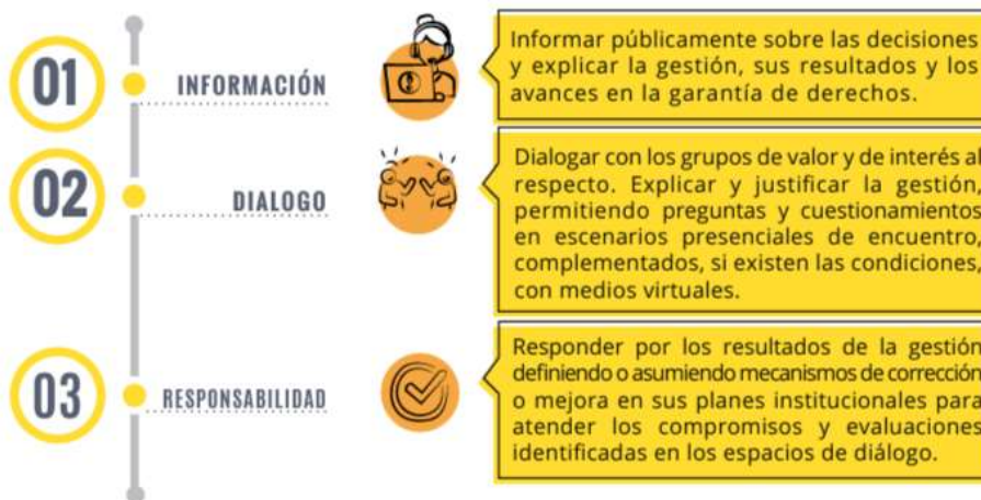
Mapa Gráfico 5 Elementos de la Rendición de Cuentas - Tomada de estrategia de rendición de cuentas Indumil 2024