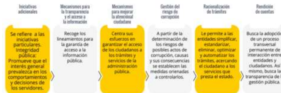
Mapa Gráfico 3 Componentes del Plan Anticorrupción y de Atención al ciudadano (PAAC)