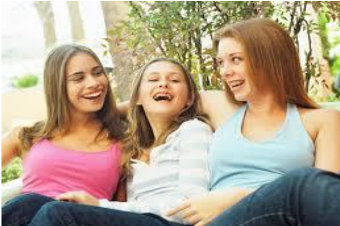
No cambies esto ...