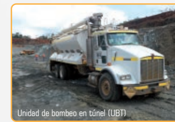
Unidad de bombeo en túnel (UBT)

Durante los últimos cinco años, el uso de emulsiones bombeables ha tomado fuerza en el mercado, especialmente en las obras de infraestructura vial con tunelería.